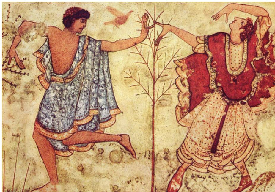
TARKINIAKO MUSEO ARKEOLOGIKOA

Etruriarren jatorri autoktonoaren aldeko teoriak aspaldi sortu ziren. K.a. I. mendean, Dionisio Halikarnasokoak ez zuen kontrakoa pentsatzeko arrazoirik topatu eta, azken bi mendeetan, geroz eta arkeologo eta historialari gehiagok