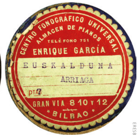
Ybarra familiaren bildumako bi zilindro, biak Bilbon grabatuak eta biak zazpi pezetaren truke erosiak: agur nerebiotzeco (sic) eta euskalduna .