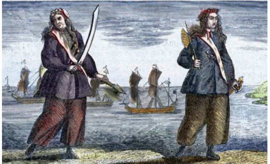
Mary Read eta Anne Bonny piratak. 300 urte dira bata hil eta bestea desagertu zela.

1708 urte inguruan, piratek Readen ontzia erasotu zuten eta ez zuen erreparorik izan haiekin bat egiteko. 1920an John Calico Jack Rackham eta haren bikotekide Anne Bonnyrekin bat egin zuen. Bi emakumeek ba omen zekiten bestea emakumea zela. Eta John