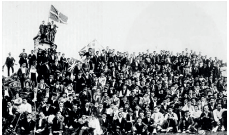
Euzko Mendigoixale Batza Arraten sortu zen duela 100 urte.

EMB sortu eta hiru urtera, 1924ko maiatzean sortu zen Euskal Mendizale Federazioa Elgetan. Baina EMB lehenago sortu izanak ez du esan nahi euskal mendizaletasuna mendigoixaleekin batera jaio zenik, haiek izan zirenik aitzindariak. 1877koak dira euskal mendizale talde antolatu bati buruzko lehen kronikak; Ganekogortoak esan zioten talde bizkaitar hari. Eta federazioa sortu ze-