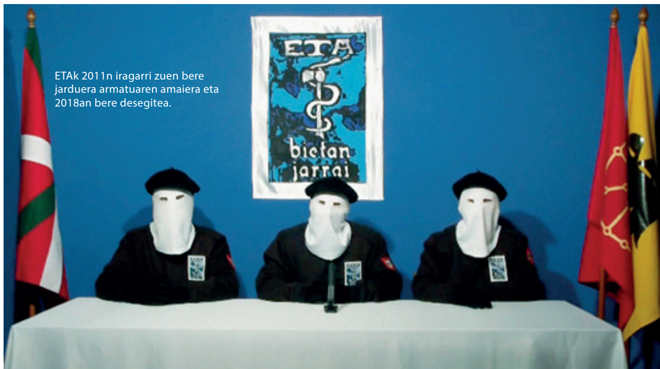
ETak 2011n iragarri zuen bere jardueraren amaiera eta 2018an bere desegitea.

Hor dago gakoa, bai. 1985 inguruan, eta barne eztabaida nahiko gogo-