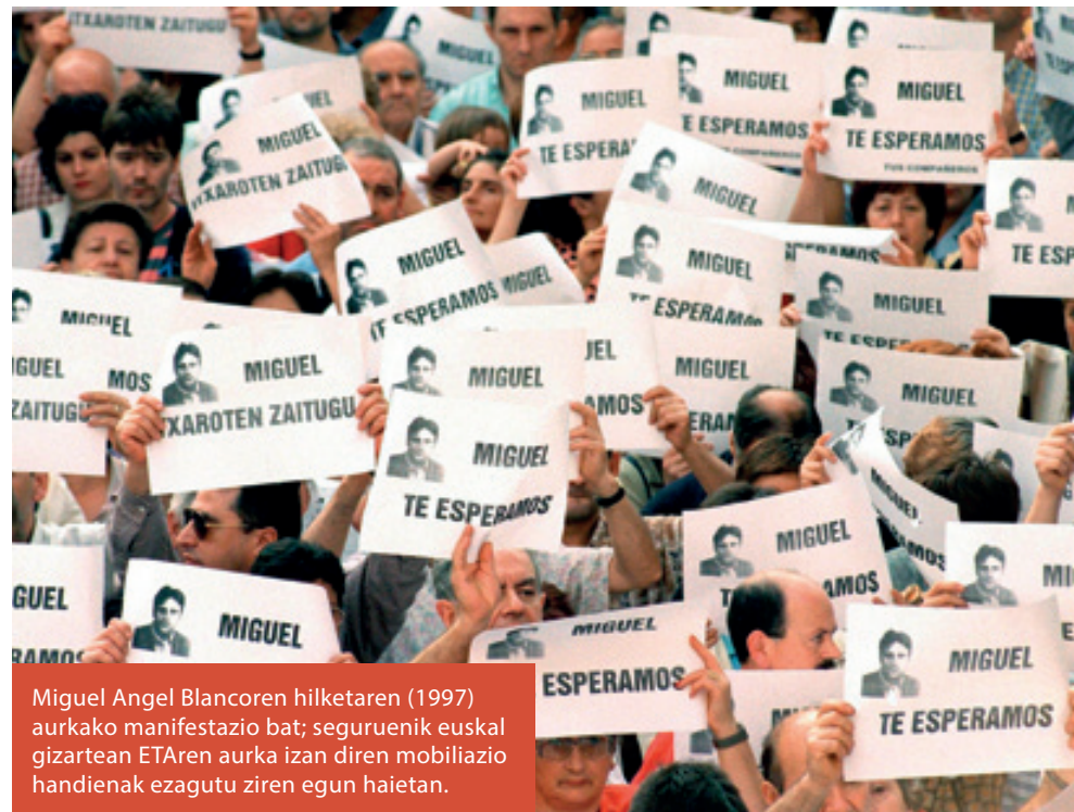
Miguel Angel Blancoren hilketaren (1997) aurkako manifestazio bat; seguruenik euskal gizartearen ETAREN aurka izan diren mobilizazio handienak ezagutu ziren egun haietan.