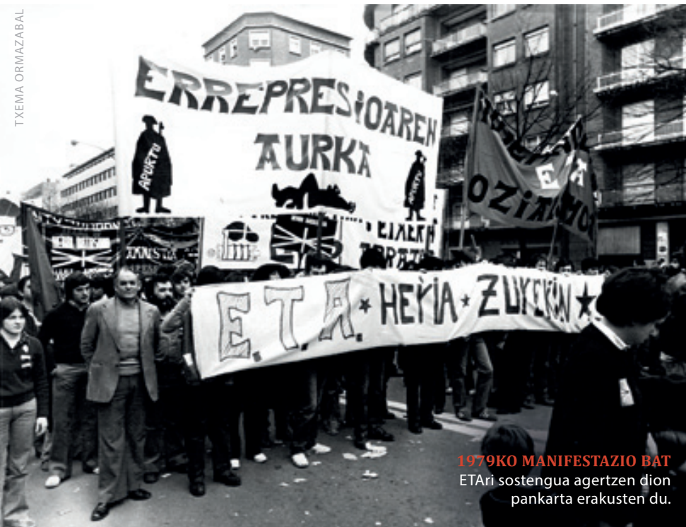
1979KO MANIFESTAZIO BAT ETArri sostengua agertzen dion pankarta erakusten du.