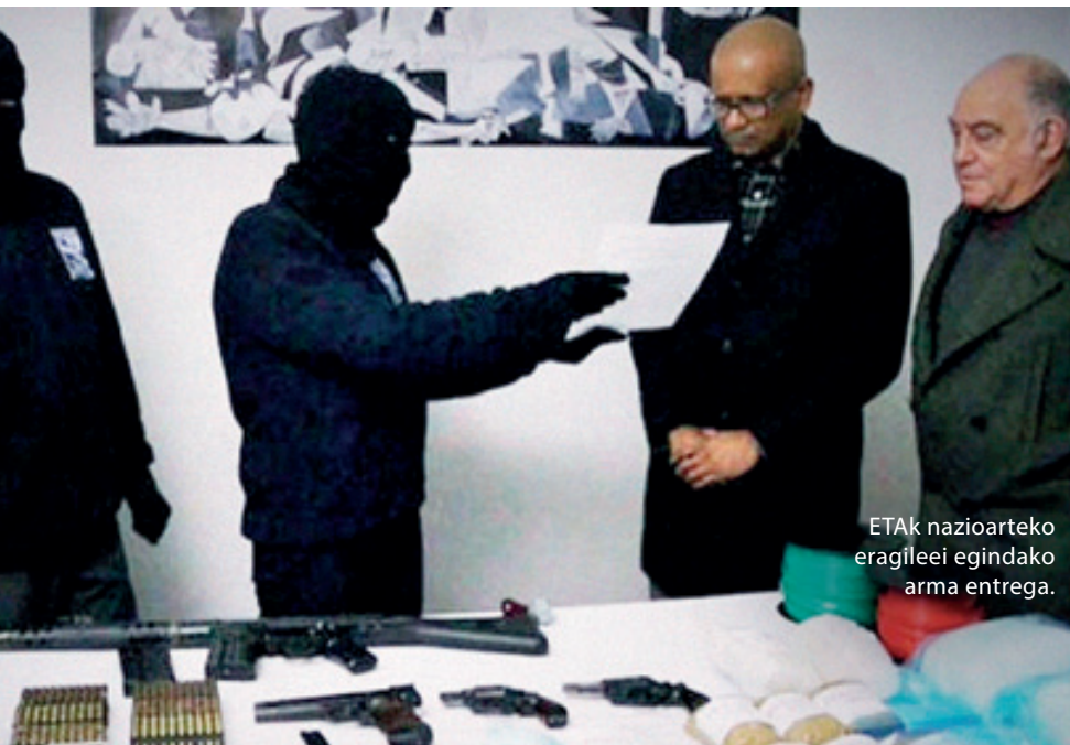
ETAk nazioarteko eragileei egindako arma entrega.