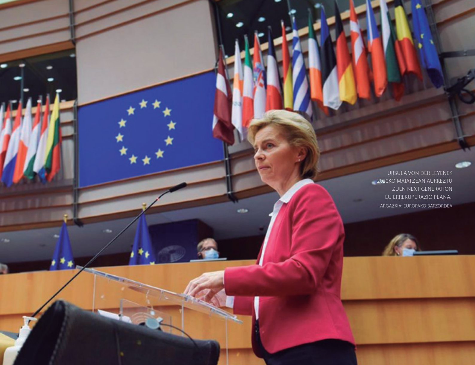
URSULA VON DER LEYENEK 2020KO MAIATZEAN AURKEZTU ZUEN NEXT GENERATION EU ERREKUPERAZIO PLANA.

125 proiektu aurreikusi ditu 3.419 milioi euroko aurrekontuarekin –ez du zehaztu europar funtsetatik zenbat diru jasoko lukeen–, tartean AHT, Nafarroako Ubidearen bigarren fasea eta antzeko azpiegiturak daude. Bi erkidego horietako proiektuak aztertu ditugu 26 eta 27 orrialdeetan. Euskal Hirigune Elkar-goak oraindik ez du NGEUrako egitasmo zehatzik aurkeztu, ARGIAri erakundetik azaldu diotenez.