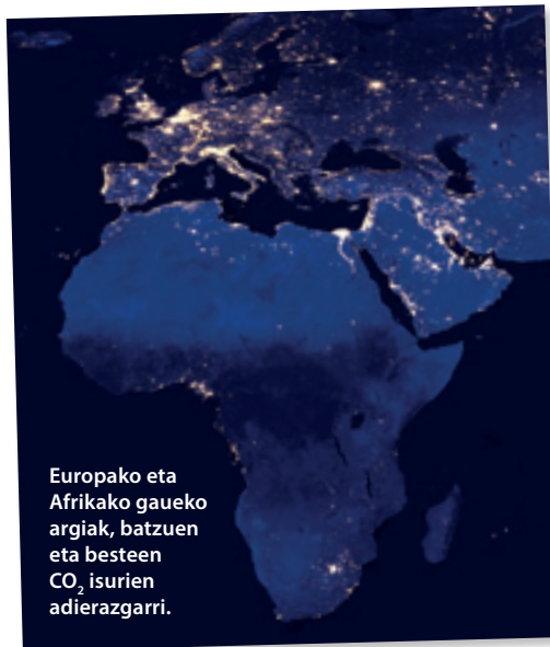
Europako eta Afrikako gaueko argiak, batzuen eta besteen CO 2 isurien adierazgarri.

Gero daukagu Edouard Glis-santek aipatzen duen ‘mestizaia’ edo ‘kreolizazio’ eredu. Honetan ez da aipatzen klimarekiko ikuspegi ezberdinen arteko txokerik, baizik eta horien mestizaiak eraman gaitzakeela klima globalaren nazioa izango den Pachamamara. Azkenik, Achille Mbembek bezala azpimarra genezake munduaren etorkizun ‘negroa’