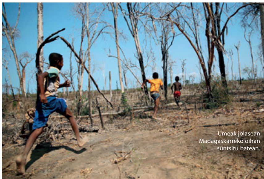
Umeak jolasean Madagaskarreko oihan suntsitu batean.

launaldik pagatu behar du modernizatzeko kapitalistak suntsitutako tximeleta afrikarren zorra? ‘Hiru hamarkada loriatsuak’ [II. Mundu Gerra ondorengo oparotasun ekonomiko aldia] ezagutu zituzten europar haien biloben belaunaldiak ala berena zen ‘tximeletaren paradigma’ sutsuki defenditzeagatik urkatu zituzten afrikarren bilobek? Nola berradiskidetu bi belaunaldi ezberdinok klimaren alde egin beharreko murrizketen inguruan, beren bizimoduak hain errotik kontrajarriak direnean?