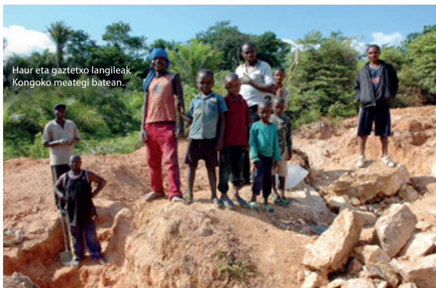
Haur eta gaztetxo langileak Kongoko meategi batean.