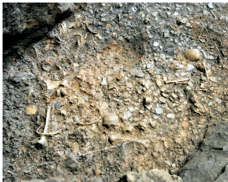
M. ROKO / J.I. ROYO

Gaur egun, Dublindarrak klasikoaren milaka kopia saltzen dira dozenaka hizkuntzatan, eta zorigaiztoko lehen edizio hartako ale urriak 150.000 euroko preziora iritsi izan dira enkanteetan. ●