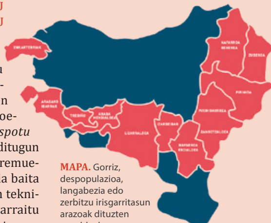
MAPA. Gorri, despopulazioa, langabezia edo zerbitzu irisgarritasun arazoak dituzten zonaldeak.

" Hauspoturen bigarren faseari ekiten gogoz gaude, eta udalgintza eraldatzailea landu nahi dugu: arlo publikoaren eta arlo kooperatibo-komunitarioaren arteko elkarlanak eta sinergiak sortzea izango da hurrengo erronka. Horretarako, udalak eta garapen agentziak proiektu honetara erakartzea gakoa izango da". Programa honi esker martxan jarri diren proiektuak egonkortzea ere helburuen artean da. ●