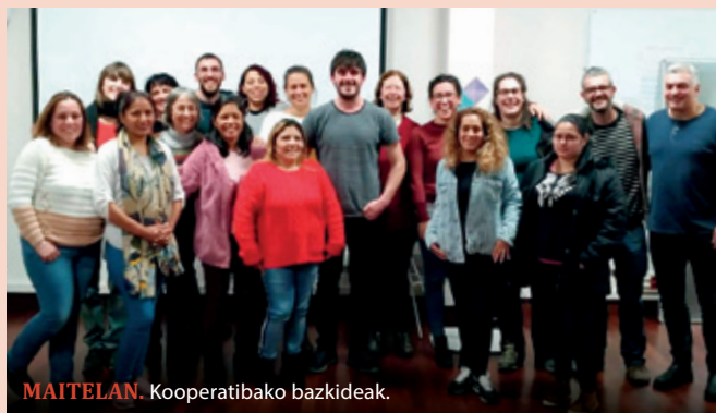
MAITELAN. Kooperatibako bazkideak.

Zaintza lanaz gain garbiketa sektoreari ere eutsi diote hasieratik, “langileei gutxieneko egonkortasuna emateko. Zaintzaren sektorea oso aldakorra baita, garbiketa zerbitzua berriz, ez”. Soldatak kooperatibizatu nahi izan dituzte, hau da, egiten zen lana edozein izanda ere, orduko kobratzen zen kopuru