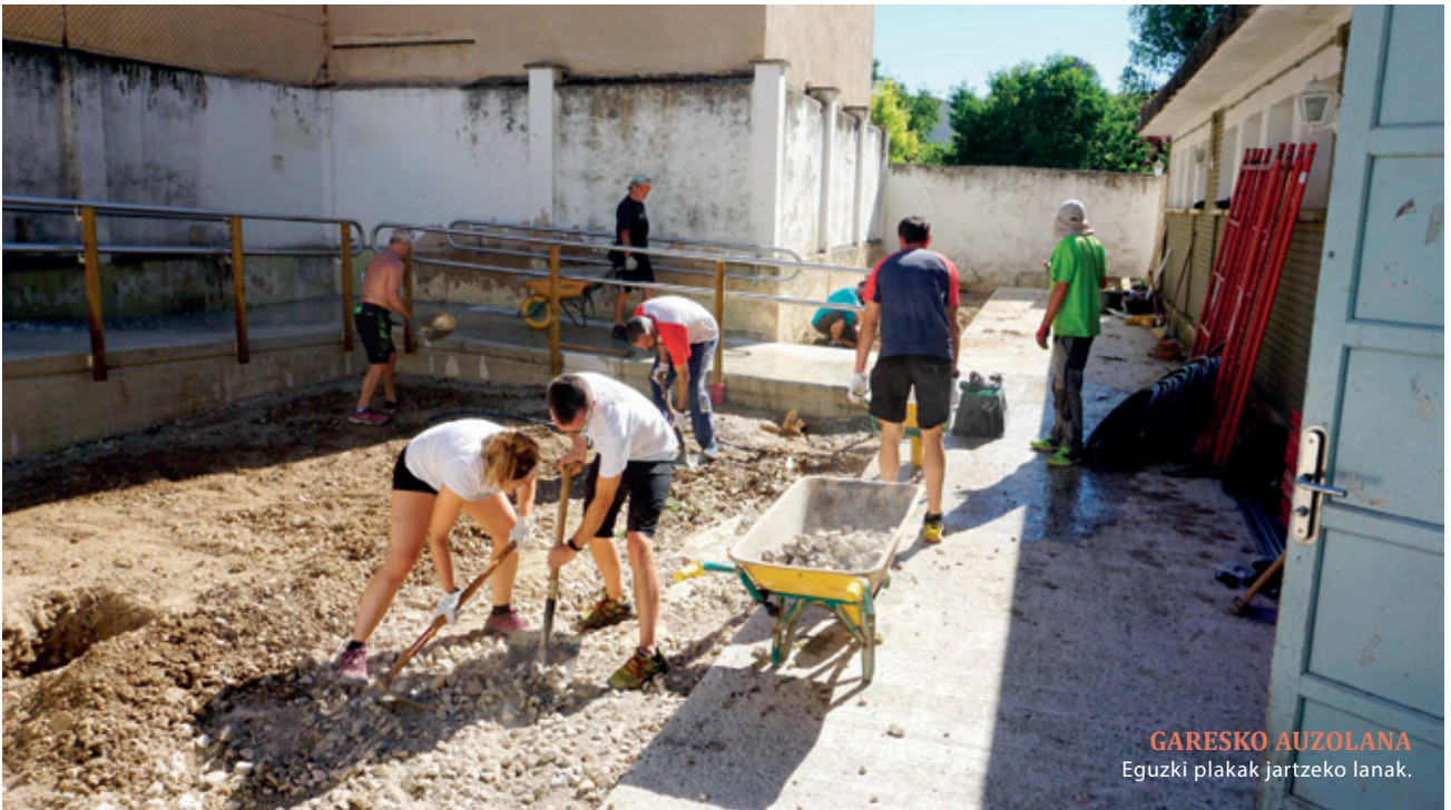
GARESKO AUZOLANA Eguzki plakak jartzeko lanak.

“Bizitza modu kooperatibo eta komunitarioan antolatzea gaur egun ez da ohikoena, ez da gizarteak daukan joera, eta horri denbora eman behar zaio, norabidea argi eduki eta ekin, eta ekin, eta ekin. Emaitzak ez dira berehalakoak izango, eta horrela ulertu behar dugu”. Horregatik, udalgintza eraldatzailea lantzeko legegintzaldia gainditzen duten eta erakundeen logiketarik arago joan behar luketen prozesuak eta proiektuak bultzatzea “ezinbestekoa” dela gehitu du.