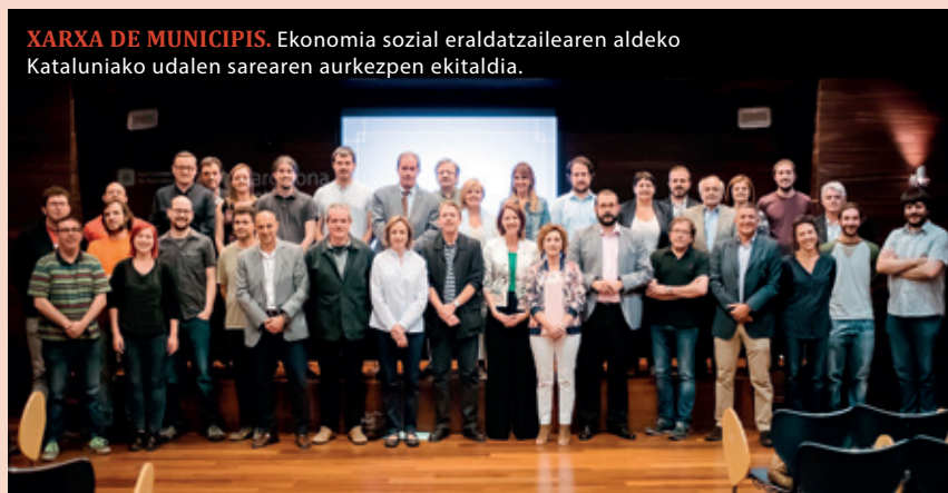
XARXA DE MUNICIPIIS. Ekonomia sozial eraldatzailearen aldeko Kataluniako udalen sarearen aurkezpen ekitaldia.

Beraz, bai ekonomia sozialeko eragileen eta bai tokiko garapenez