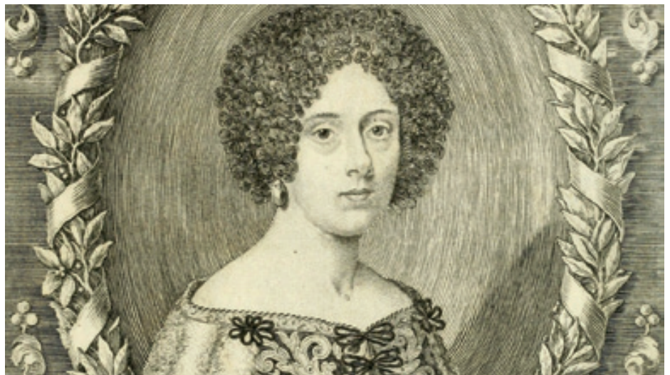
ELENA CORNARO PISCOPIA (1646-1684).

Bere tutoreek gomendatuta sartu zen Paduako unibertsitatean eta, emaitza bikainak lortuta, esan bezala, 32 urterekin lortu zuen filosofian doktoretza titulua, Aristotelesen pasarte batzuk aztertu ondoren. Unibertsitateko karguek