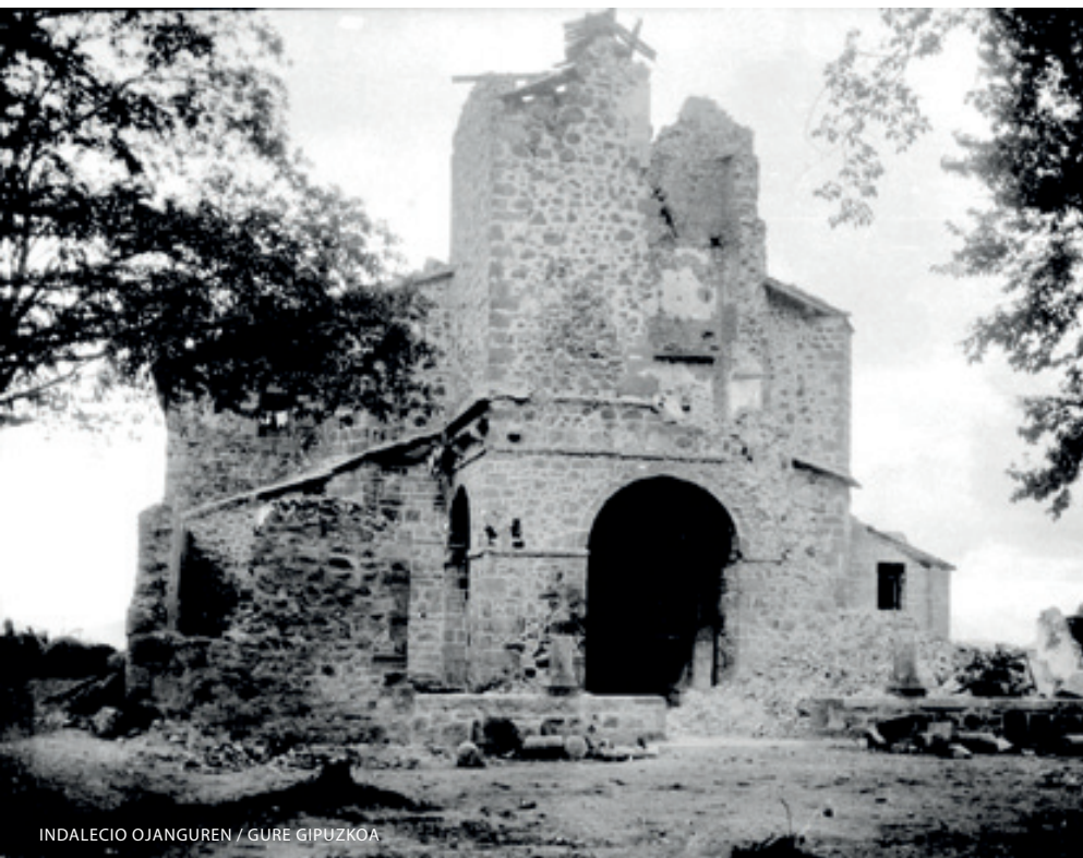
INDALECIO OJANGUREN / GURE GIPUZKOA