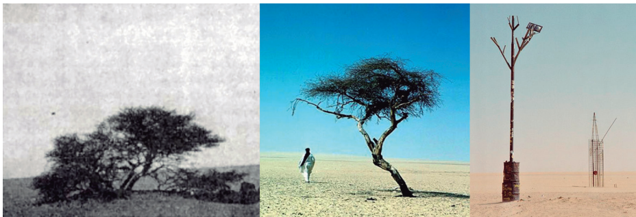
ESZKERREAN, TÉNÉREKO ZUHAITZA 1939AN. ERDIAN, ZUHAITZ BERA –EDO GERATZEN ZITZAION ZATIA– 1970EAN. ESKUINEAN, GAUR EGUN ZUHAITZA ORDEZKATZEN DUEN METALEZKO EGITURA.

Beraz, azaletik gora tuaregak arduratzten ziren zuhaitza zaintzeaz. Lurpean aldiz, akazia bera arduratzen zen, inguru ankerrari egokitzeko gaitasun ikaragarria