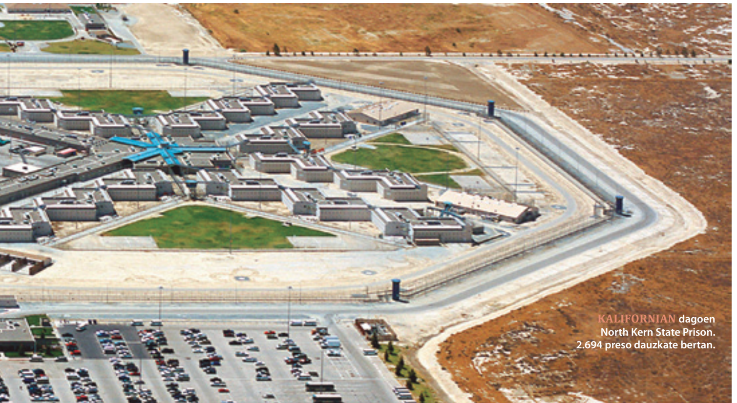
KALIFORNIA dagoen North Kern State Prison. 2.694 preso dauzkate bertan.

ekologistekin eta beste hainbatekin indarrak batuz; espetxea eta zigorra krimenaren konponbide zuzena dela defendatzen duen ideia desegiten hasi ginen. Ondorioz, 2000. urterako Kaliforniako espetxeetan aurreikusten zen preso kopurura ez iristea lortu genuen. Abolizionisten lanari esker gertatu zen hori, eta lan hori hedatu egin behar dugu. Los Angeleseko konderrian hainbat garaipen ikusi dugu: hamabost urteko borroka eta gero, milioi askoko aurrekontua zuten hainbat espetxeren eraikitzea bertan behera geratzea lortu dugu. Egin dezakegu, posible da. ●