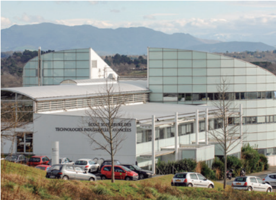
ESTIA industria eta teknologien goi-eskola, "EGE" kartaren egitura ekonomikoetan ari da.

rreta taldea aitzindaria da. Ildo horretan, taldeak jardun-txosten berria eza-gutarazi zuen iragan urteko abenduan.