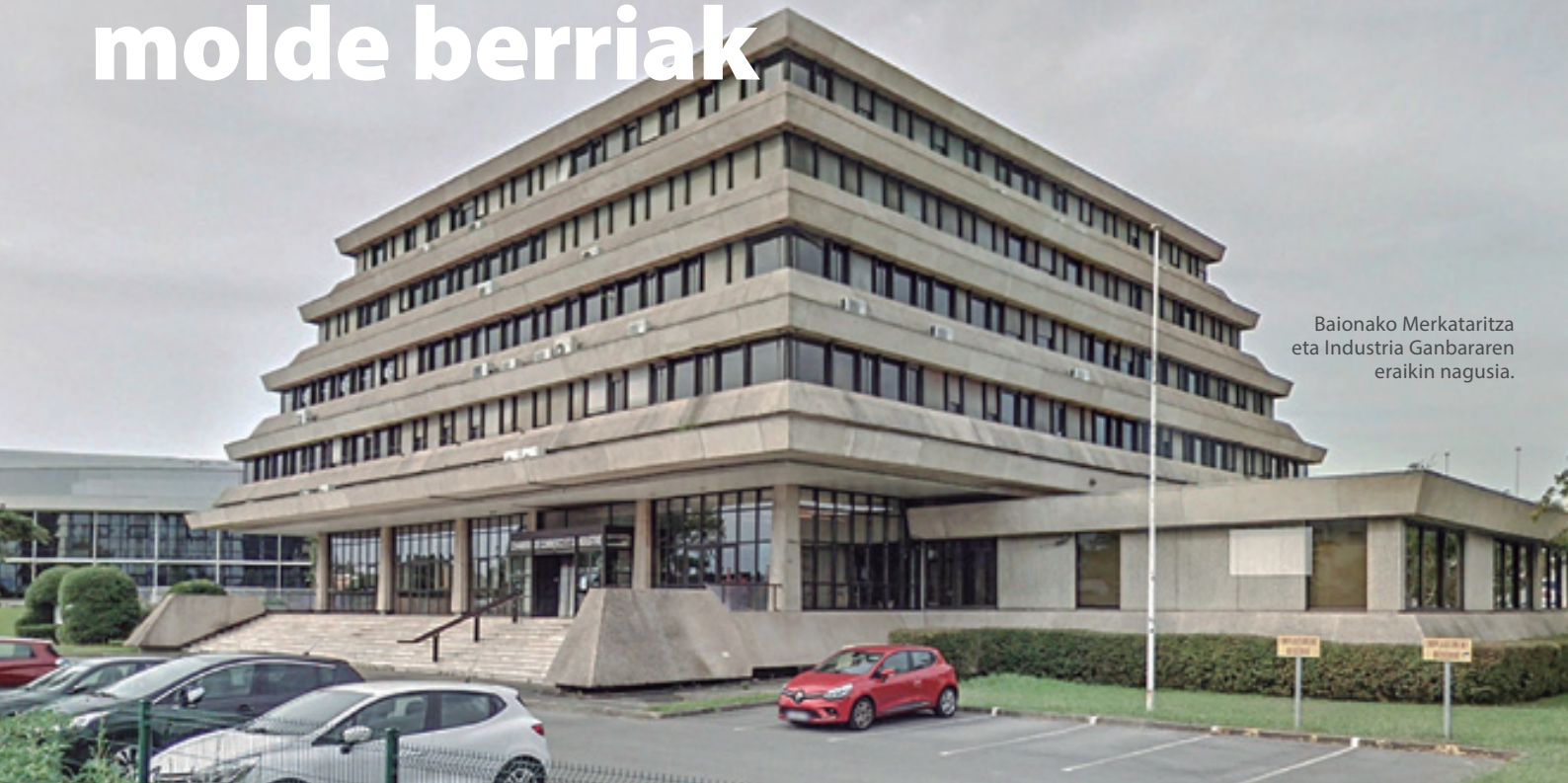
Baionako Merkataritza eta Industria Ganbararen eraikin nagusia.