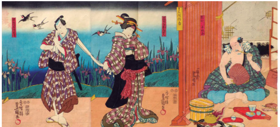
1850 URTE INGURUKO GRABATUA, KABUKIKO AKTOREAK IRUDIKATZEN DITUENA, GUZTIAK GIZONEZKOAK (ERDIKOA ERE BAI).

Eduki sexuarek, estetika transgresoreak –maiz Okunik berak gizonetzkoen jantziak erabiltzen zituen eszenatokian–, istorioak kontatzeko molde berritzaileak, aktoreekin sexu harremanak izateko aukerak... herri-tarren pasioak piztu zituzten. Orduko japoniarren herenak aldioro katana edo ezpata bizkarrean zeramatela kontuan hartuta, Ikuskizunek amaiera odoltsua izaten zuten sarri. Horregatik, 1629an agintariak liskarrik saihesteko neurriak hartu zituzten. Kabukian armak debekatu zituzten? Ez, emakumezko aktoreak debekatu zituzten.