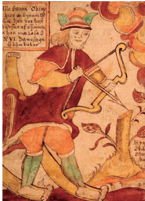
EZKERREAN, ULLR JAINKO ESKANDINAVIARRAREN IRUDIA (XVIII. MENDEA). ESKUINEAN, SKAÐI JAINKOSAREN ILUSTRAZIOA (1901). BIAK ESKIEKIN DAUDE IRUDIKATUTA.

Vikingoak gerrari anker eta basatizat ditugu, baina denbora gutxi ematen zuten horretan. Arpilatzea ez zen haien jarduera ekonomiko nagusia, nekazaritza baizik. Negu luzeko elurrak eta izotzak urtuta, udaberri amaieran, lurra prestatu eta laboreak ereiten zituzten. Ekainean, Ipar itsasoko urak baretzen zirenean irteten ziren itsa-