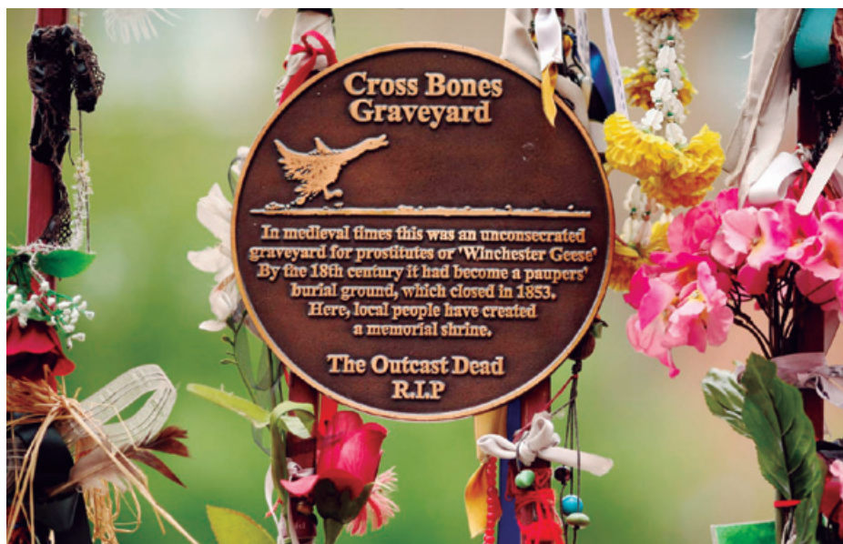
CROSS BONES HILERRIKO HESIAN PLAKA OROIGARRI BAT DAGO, ANTZARA BATEN IRUDIA DUENA, SOUTHWARKEKO PROSTITUTEN OMENEZ. HESIA LOREZ ETA MEZUZ JOSITA DAGO.

Bere antzarek esker aberastu arren, haietako bat hiltzen zenean hilerrian –lur sagaratu– ehorztea debekatu zuten