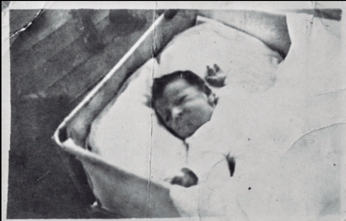
Agnes America Winnipeg jaio berritan, itsasontzian ateratako argazkian.