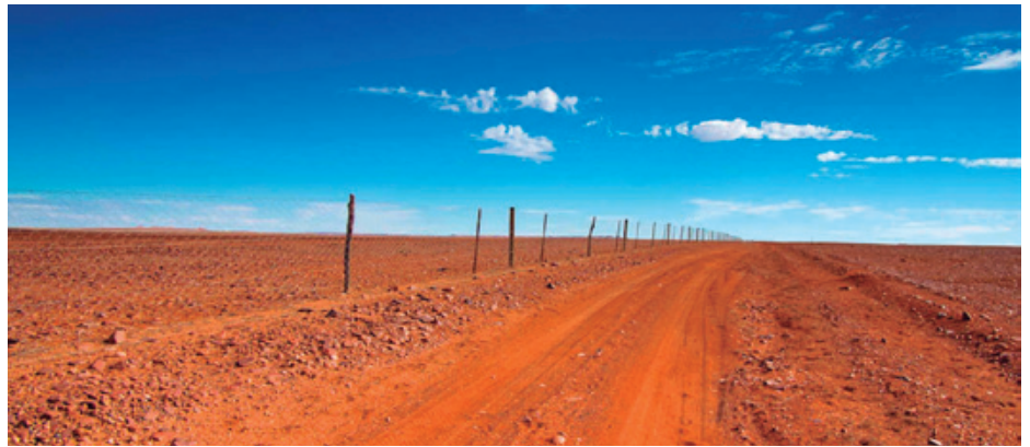
AUSTRALIAN UNTXIEN KONTRA JASOTAKO 3.000 KM-KO HESIAREN ZATI BAT.

1920rako Australiako untxien populazioa 10 mila milioikoa zen. Belarra, landare txikiak eta zuhaitz gazteak janez egin zuten aurrera. Sustraiak ere jan zituzten, landare berriak haztea galaraziz eta, ondorioz, ber-