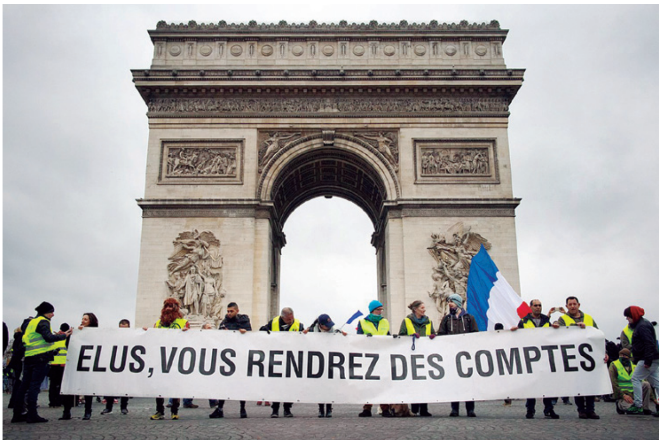
📷 “Hautetsiok, kontuak eman beharko dituzue” diote Parisko Garaipen Arkuaren aurrean.

Ez da kasualitatea erregaien zergen gaiak hain azkar piztu izana protesta bat zeinaren ikonografia hain sakon txertatua dagoen automobilaren kulturaren. Hasieran mugimenduaren berri Internetez zabaldu zen, baina benetan bere irudia gorpuztu zen autoen aginte-mahaian ipinitako jaka horian: autorik ez bazenu ez zenuke aginte-mahairik edukiko eta ziurrenik jaka horirik ere ez. Protestaren eremua ez zegoen fabriketan edo unibertsitatean, ez udaletxe atarian eta ezta norbere auzoan ere: zegoen herrien ingurubideetako rotondetan –non kotxezaleak besterik ez diren ikusten–, eta batzuetan autobideetako bide-sari