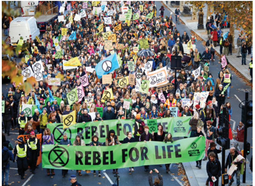
📷 Extinction Rebellion mugimenduaren manifestazio bat, Britainia Handian.

Jadanik Brexit erreferendumak bitan zatitu duen Britainia Handian, oso urriak dira austeritatearen eta neoliberalismoaren aurka ezker eta eskuineko fronte bat sortzeko aukerak. Seguru ez dela gertatuko protestalariek soinean eramanez matxinaden kontrako polizien eta