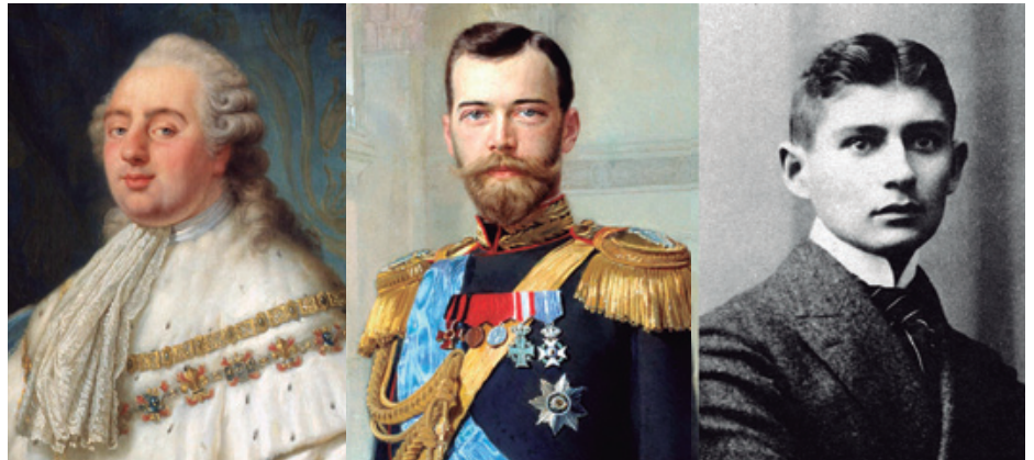
LUIS XVI.AK, NIKOLAS II.AK ETA FRANZ KAFKAK SARRERA BITXIAK IDATZI ZITUZTEN BEREN EGUNKARIETAN UNE HISTORIKO SEINALATUETAN.

Ez zen bera izan egun historikoetan errealtatetik urrun bizi zen monarka bakarria. 1917ko otsailaren 23an -martxoaren 8a, gregoriar egutegiaren arabera- Errusiako Iraultzaren lehen fasea, Otsaileko Iraultza, abiatu zen Petrogrado hiriburuan. Gizonezko gehienak frontera bidaliak zituzten, emakumeek soldata eskasak truke lanaldi luzeak egin behar zituzten fabriketan eta erosteko ahalmenak behera egin ahala, hornikuntza arazoek eta goseak gora egin zuten. Biharamunean errebolta zapaltzeko ahalegin bortitzek ez zuten helburua lortu. Egun batzuk geroago protestak herrialde osoan zabal-