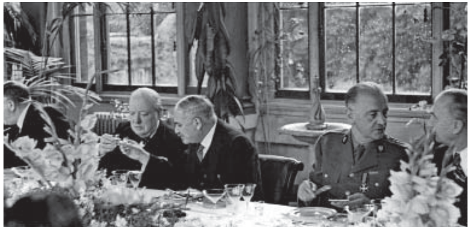
WINSTON CHURCHILL (EZKERREAN) ENBAXADORE ALIATUEN BAZKARIAN, 1941EKO IRAILEAN. HILABETE BATZUK GEROAGO 'BEGETARIANO OPERAZIOA' PRESTATZEKO AGINDUA EMANGO ZUEN.

Londresko xaboi fabrika batean 5 milioi pasteltxo ekoitzi zituzten eta arma berriaren eraginkortasuna Eskoziako Guinard uhartean frogatu zuten. Uharre pribatua gerra amaituta 500 libarren truke berreskuratzeko aukera izango zutela esan zieten jabeei. 1943an 50 ardi utzi zituzten uhartean eta antrax esporek hiru egunetan hil zituzten denak. Gorpuak labar batetik behera bota eta, dinamita detonatuta, harriz estaltzen saiatu ziren.