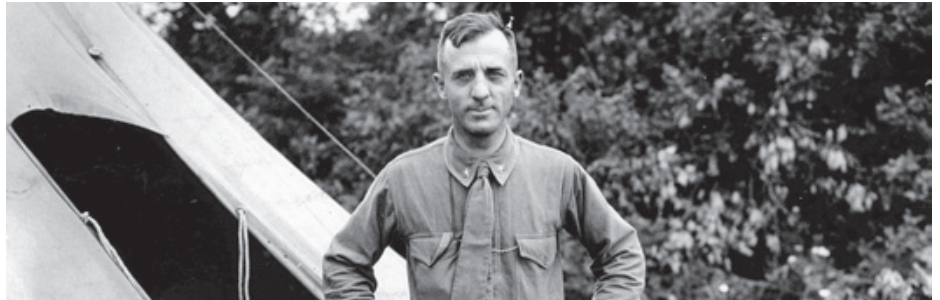
SMEDLEY D. BUTLER (1881-1940) MILITAR KONDEKORATUA ETA EKINTZAILE BAKEZALEA.

zerrenda luzea osatu nuen eta, horregatik, dominaz eta ohorez saritu ninduten”.