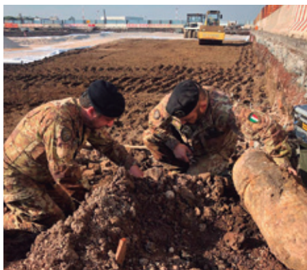
ITALIAKO DEFENTSA MINISTERITZA