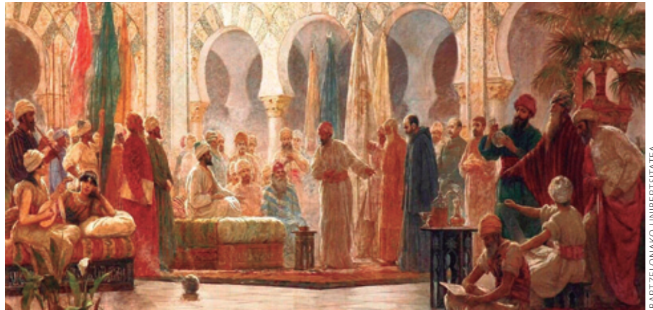
'ABD AR-RAHMAN III.A ETA BERE GORTEA', DIONISIO BAIXERAS, 1885. KORDOBako LEHEN KALIFAREN BIRRAMONA, AMONA ETA AMA BASKOIAK ZIREN.

Muhammad eta Muznaren seme Abd ar-Rahman III.ak bere burua kalifa izendatu zuen eta Kordoba Mendabaldeko Kaliferriaren hiriburu bihurtu. Bilakera hura justifikatzeko, omeiatarren oi-