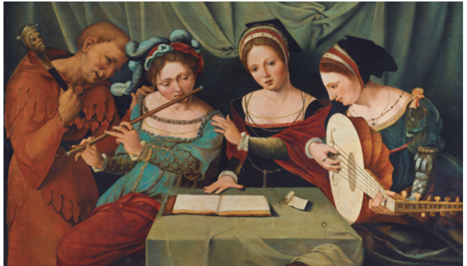
'HIRU EMAKUME GAZTE MUSIKA EGITEN BUFOI BATEKIN', XVI. MENDEKO LAN ANONIMOA

Ornamentazio oparoa eta bertuosismoa ziren taldearen ezaugarri nagusiak, eta garaiko konpositoreentzat pieza be-