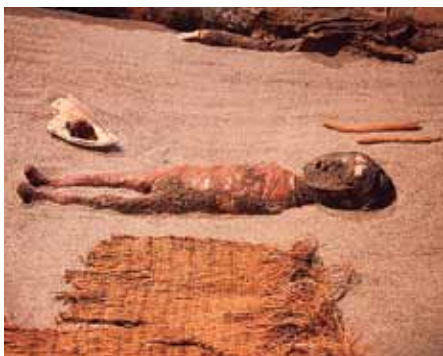
SAN MIGUEL DE AZAPA ARKEOLOGIA MUSEOEA

Baina Arrikruzeko aurkikuntzarik garrantzitsuen lehoiarena da, Iberiar penintsulan aurkitutako lehoi eskeletorik osoena baita, Europako bakanetakoa. Ia bi urte behar izan zituzten eskeletoa piezaz pieza galeriatik ateratzeko, eta, orduz geroztik ondo gordeta dago. 2007tik Arrikruz zabalik dago bisitarientzat; kobazulo sareko 500 metro ibili daitezke eta lehoiaren erreplika bat ikusteko aukera ere badago. Baina benetako hezurdura ikusteko aukera gutxi daude. Pribilegio hori izango dute Donostiako San Telmo Museora datorren otsailaren 10a bitartean hurbiltzen direnek. ■