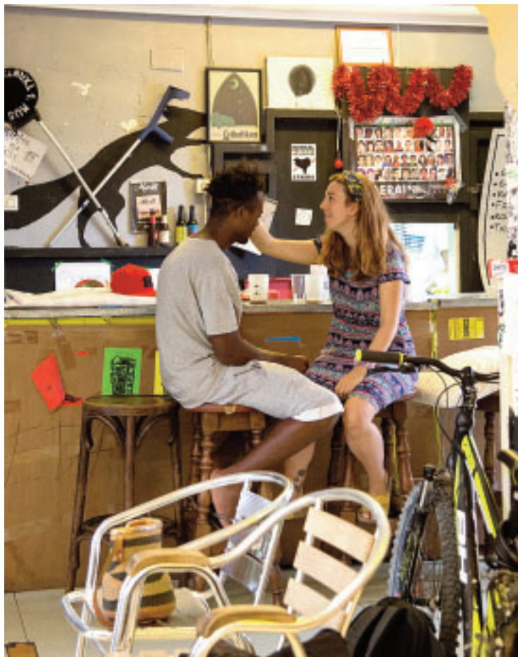
Donostiako Txantxarreka gaztetxean.