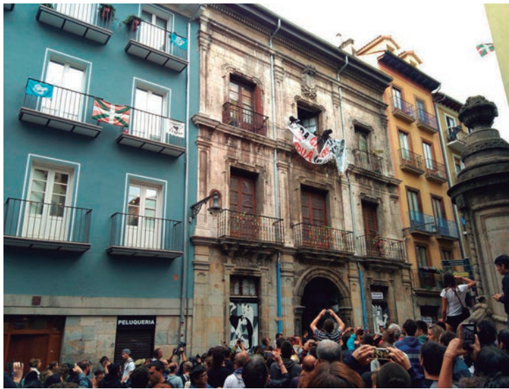
Abuztuaren 17ko arratsaldea, Nabarrerria plaza gazteek Maravillas gaztetxea berrokupatu zuten unean.