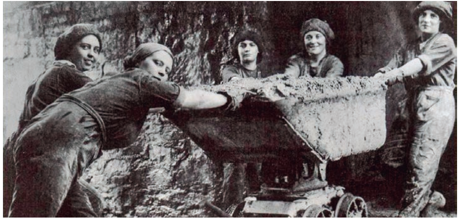
Emakumeak meatzean lanean Galesen, Lehen Mundu Gerra garaian

Domitila Barrios Chungara (1937-2012) boliviarrak Siglo XX meatzean jaio eta hazi zen. Senarra meatzaria zuen eta haren eskutik hasi zen meatzarien eskubideen aldeko borrokan. Besteak beste, Hugo Banzer jeneralaren diktadura mi-