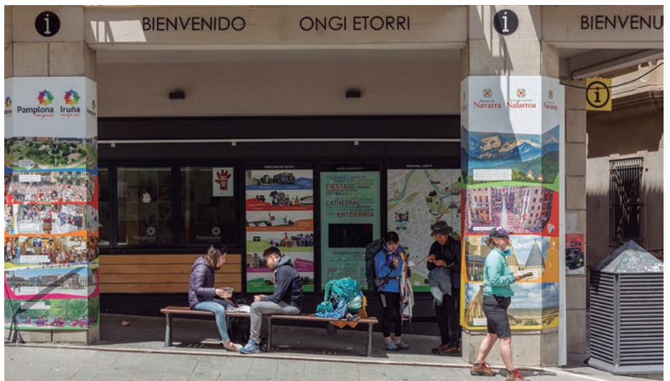
Turistak Iruñeko Udal plazan dagoen turismo bulegoaren aurrean.

Beste hiri batzuetan arazoa askoz larriagoa da. Beatriz Corredor Espainiako Gobernuako Etxebizitza ministro ohiak (PSOE) duela gutxi Madrilen egindako mahai-inguruan azaltzen zuenez ( El Diario , 2018-4-19), herritarrek dagoeneko ezin dituzte garai bateko hipotekak eskatu, prekarietateak ez dielako uzten.