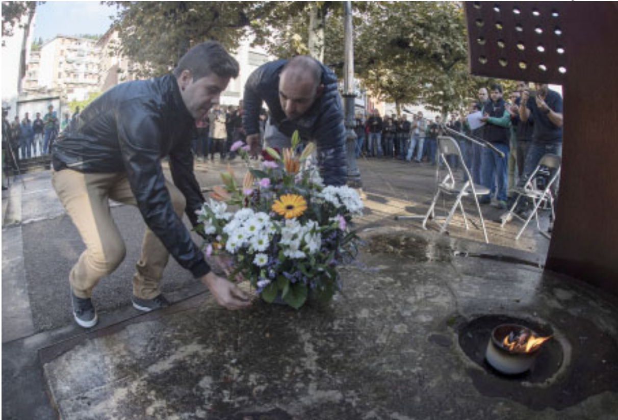
Beasaingo CAFen amiantoagatik hildakoen oroigarrian omenaldia 2017ko urrian.

Egunkariak apenas utzi diote tarterik teletipoari. Emakumea 22 urtez aritu zen lanean Erretereria-ko isolagailuen fabrika batean, autoen baterientzako estalkiekin egiten zuen lan; baina ez ziren plastiko hutsak, amianto zuntzez egindako artefaktu arriskutsuak baizik, eta berak egunero-egunero lixatzen zuen estalki bat bestearen atzetik, printzak kentzen zituen nola eskuarekin edo putz eginez. Lana utzi eta hiru hamarkada geroago sortu zitzaion asbestosia, eta orain, enpresa hura erosi zuen multinazionalak laneko gaixotasunagatik jasotzen duen prestazioaren %30 ordaindu beharko dio EAEko Auzitegi Nagusiaren epai baten aginduz. Baina epaia ez da irmoa, eta seguruenik emakumeak berriz ere egin beharko du auzitegirako bidea birrikak lehertzeaz, azken bost urteetan egin izan duen bezala.