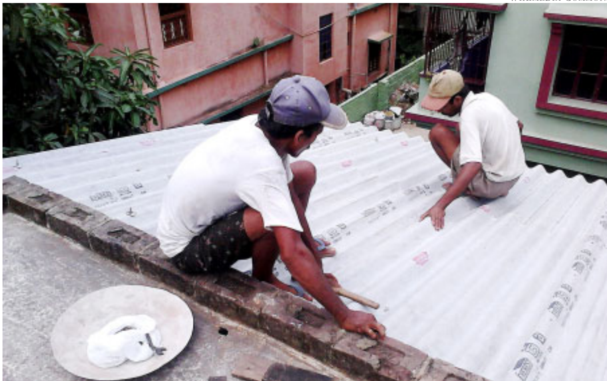
Indian amiantoz egindako teilatua jartzen 2011n. Everest Asbestos Cement irakur daiteke teilen itsasgarrietan, egun abestoarekin lan egiten duen enpresa ugarietako bat.

Gaur egun asiar herrialde gehienetan jendea asbestoa prozesatzen ari da inolako babesik gabe: Txinan, etxean lan egiten dutenek –normalean nekazariak eta haien emazteak– euren egongelan sailkatzen dituzte amianto zuntzak eta ondoren fabrikara bueltatzen dituzte han prozesatzeko. Indiako fabriketako langileek asbesto zakuak labanaz moztu eta eskuz irekitzen dituzte, gero zuntz konpaktatua egurrezko mailu batekin hausten dute zementuarekin nahastu aurretik. (...) Ehunka mila ari dira lanean, ahoa mukizapiekkin soilik estalita dutela.