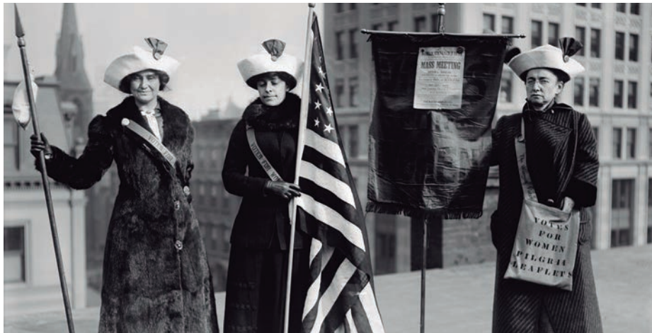
AEB-ETAKO KONGRESUKO LIBURUTEGIA

New Jerseyko konstituzioaren pasarte horrek dio: “That all inhabitants of the Colony (...) shall be entitled to vote” . Hau da, “biztanle” guztiak zutela bozkatzeko aukera; “personak” aipatu ez arren, testua anbigua da generoari dagokionez. Baina 20 urte geroago, 1796an, bozkatzeko prozesua zehazteko dekretu bat onartu zuten: “That every voter shall openly, and in full view deliver his or her ballot” . “His” eta “her”, izenorde posesi-