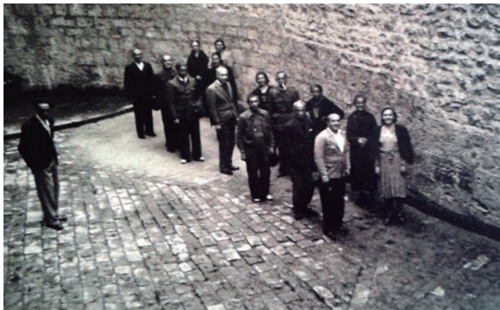
Emakume askok koinata itxurak egiten zituzten presoak bisitatu ahal izateko, horrek zekarren arriskuarekin.

Beste emakume askok, ordea ez zuten modurik sorterrian geratzeko, ondasunak lapurtu zizkietelako edo lanik ez zietelako ematen. Iruñean gutxienez senidea ikusteko aukera izango zuten... Haietako asko hirian geratu ziren, baina jakina, ez ziren oharkabean pasatzen eta zailtasun handiak bizi izan zituzten. Nolanahi ere,