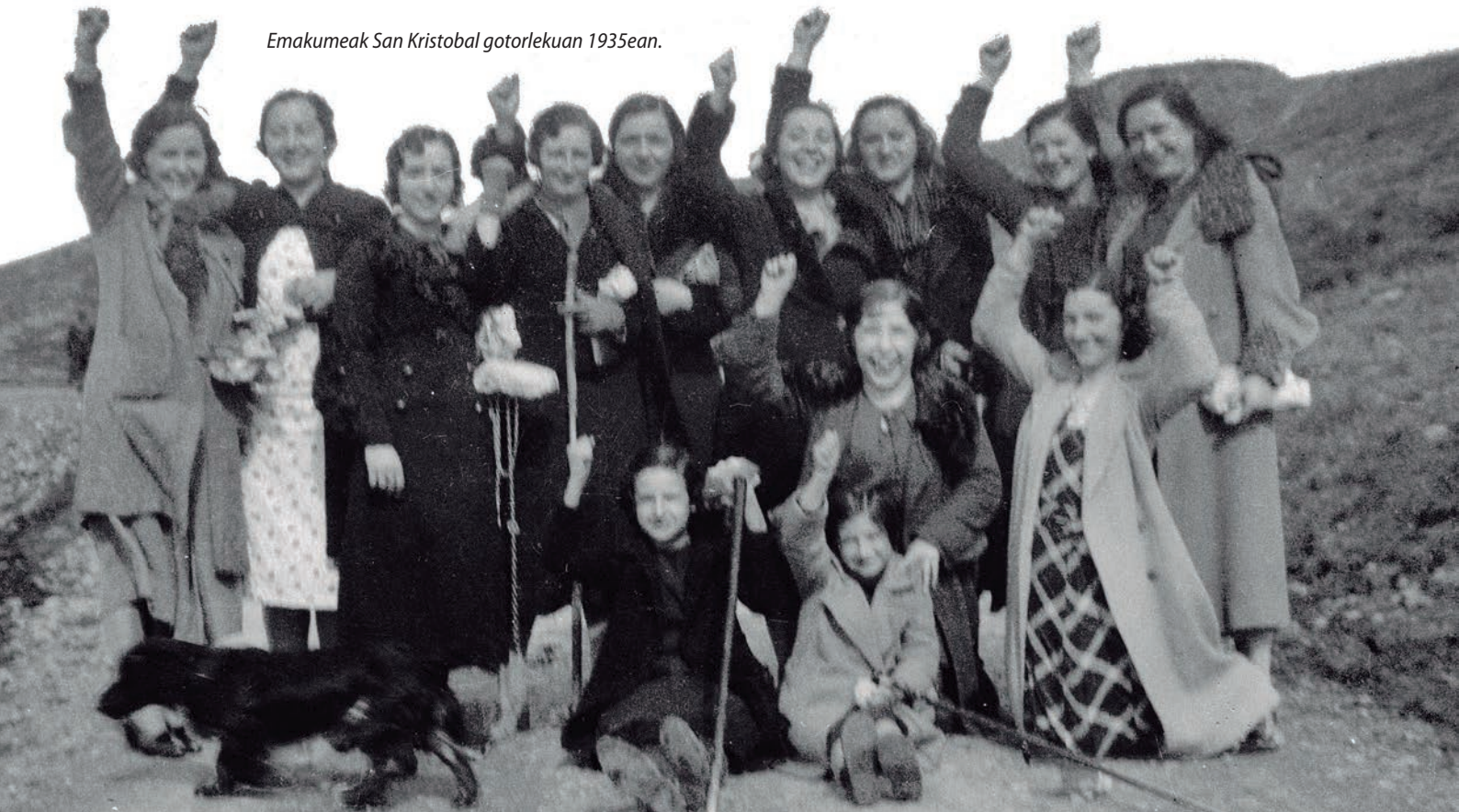
Emakumeak San Kristobal gotorlekuan 1935ean.

San Kristobaleko emakume solidarioen historia 1934an hasten da. Urte hartako urriko iraultzaren ondorioz preso hartutako ezkertiarak laguntzeko sareak sortu zituzten. Ideologiak bultzatuta, talde sozialistak, komunistak eta anarkistak igotzen ziren batik bat Ezkaba mendian gora presoak ikustera, Nazioarteko Laguntza Gorriaren babespean esaterako. Iruñeko egunero-