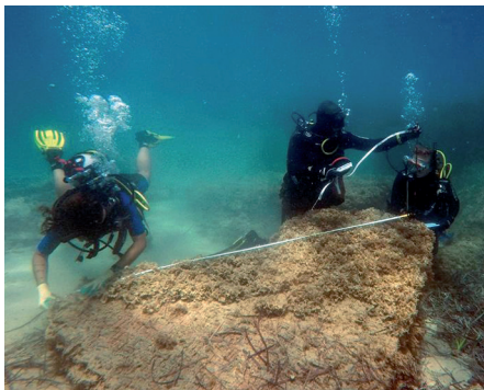
TUNISIAKO ONDAREAREN INSTITUTUA / SASSARIKO UNIBERTSITATEA