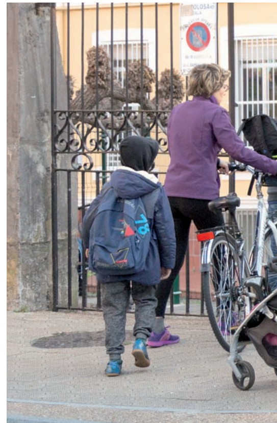
Nahita edo konturatu gabe, baina guraso askok haurrak ondoan dituztenean euskaraz gehiago egiten dute urrutiratzen direnean baino.

Eskoletako atarietan, sartu-irtenetako ordutegietan, euskarak presentzia gehien duen momentua guraso eta haurren arteko elkarrizketena izaten da. Zehazki, seme-alabak eta gurasoak elkarrekin hitz egiten ari direnean, kasuen %74,90etan euskaraz hitz egiten dute; gaztelaniatz %22,09 aritzen dira, eta %3,01 beste hizkuntzatan.