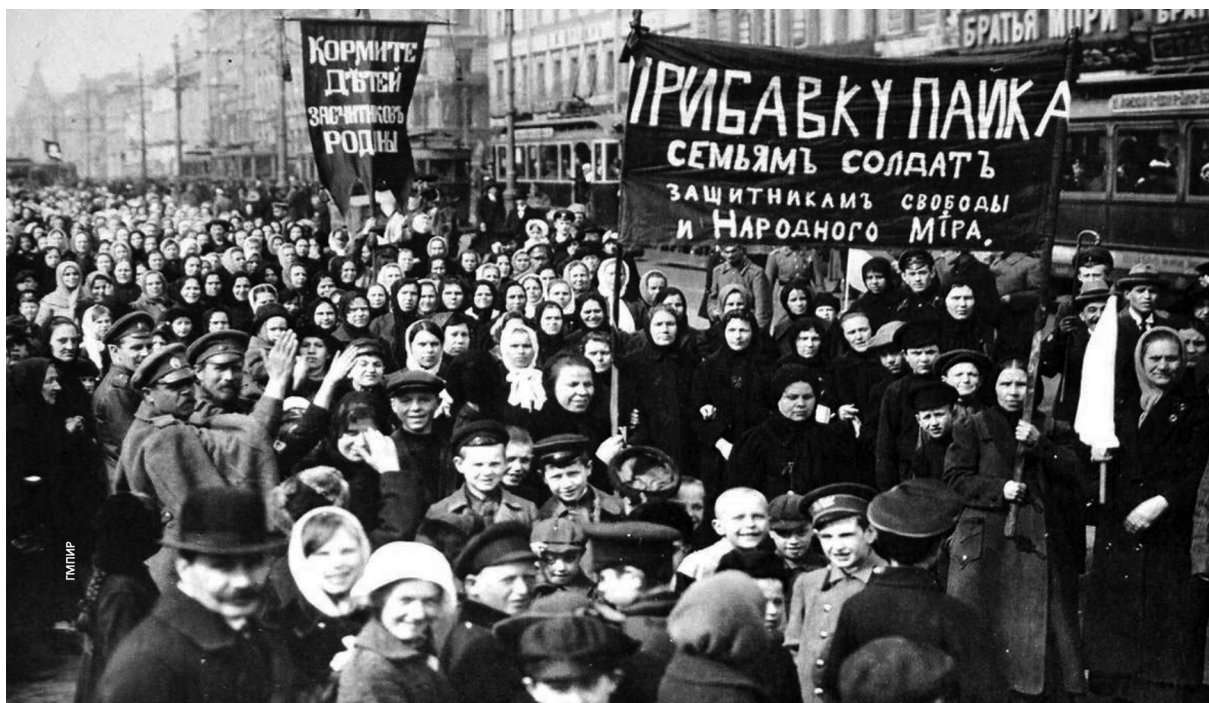
Petrogradoko Putilov lantegi erraldoiko emakume langileak 1917ko martxoaren 8an.

Populismoak XIX. mendean eragin nabarmena izan zuen Errusiako bizitza intelektual eta politikoa. Narodniki -en mugimendua ( narod =