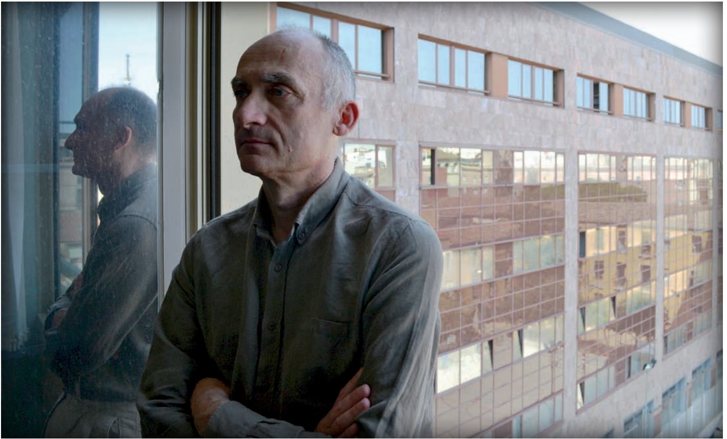
“Aktualitatearen aginte moduko bat dago, eraginkortasun tiraniko izugarria duena”.

“Intimo” hitza ere agertzen da izenburuan. Baina ez barrukoa, baizik eta gertukoa.