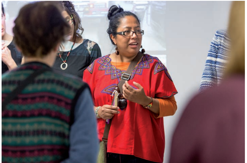
Donostiako Kaxilda liburu-dendan tailerra eman zuen Cabnalek Bilgune Feministaren eskutik. Elkarrizketan ez bezala, orduan gustuko duen arropa tradizionala jantzita aritu zen.

Kolonizazioaren hastapenetako dokumentu asko daude, gizon indigenek idatziak, eta horiek irakurri ostean proposatu genuen uztartzearen teoria. Agirietan kontatzen da nola, gizon indigena askok, mandatariek-eta,