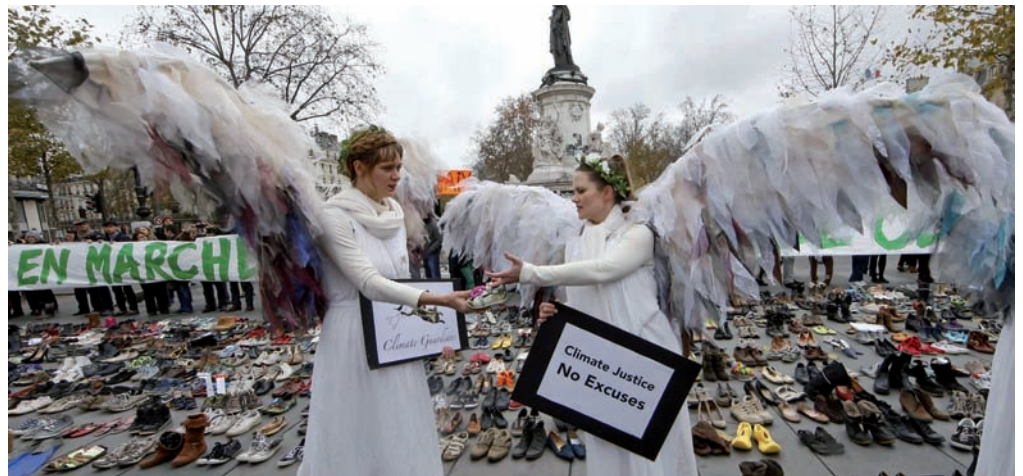
Avaaz elkarteak 10.000 zapata baino gehiago biltzea lortu zuen azaroaren 30ean Parisko Errepublikaren plazan, manifestazioak egiteko debekuagatik protestan.

Propaganda, boterea eta hedabideak triangulu beraren ertzak dira, jabearen ahots bilakatzen direnean.