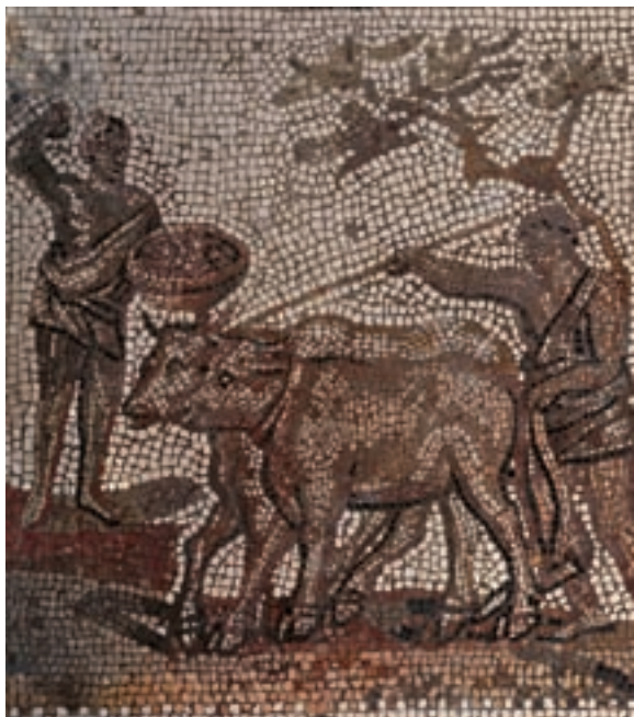
Galiako etxalde erromatar batean aurkitutako mosaikoa, Inperioan zabaldu zen nekazaritza irudikatuz.

Higadura jarri dezakegu eskeman kutsadura (“ pollution ”) dagoen lekuan. Nekazaritzari kalterako eragiten dio. Populazioa gutxi arazten du eta dena bihurtzen okerragora. Zenbat eta gehiago behartu nekazaritza populazio handiagoa (tartean legioak) elikatzeke, orduan eta gehiago bortsatzen duzu zoru emankorra. Hau ez da baliabide berriztagarria; mendeak behar da zoru emankorra berregiteko, behin galduz gero. Higadurak hondatzen dizu nekazaritza, populazioa gutxitzen zaizu, legioak ere gutxiago dauzkazu eta azkenean... barbaroek inbaditzen zaituzte.