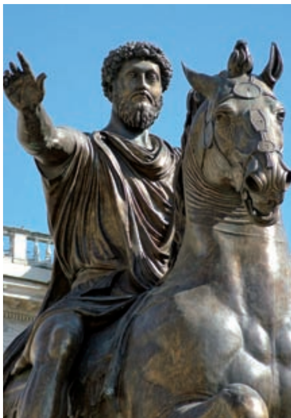
Marcus Aurelius enperadorea zaldi gainean, Erromako Kapitolioko muinoan.

Zur eta lur dago Enperadorea, baina pazientzia handiko gizona da. Filosofoa, azken finean. Ez du aginduko zuri lepoa moztea, beste enperadoreek egingo zuten moduan, eta galdetu dizu: “Baina zergatik diozu hori, druida jakintsua?”.