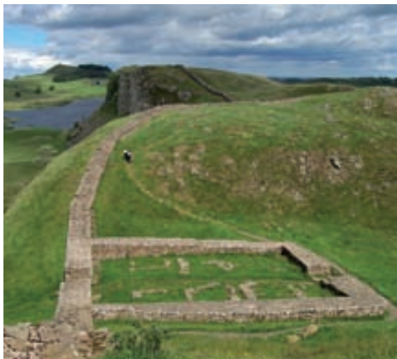
II. mendean Hadrianusek Britainia iparraldean kaledoniarrek (gaurko eskoziarrak) mugaz kanpo atxikitzeke eraikitako harresiaren hondarrak.

eraikitzea alferrikakoa izateaz gain baliabide gale- ra handia zen. Imajinatu ditzakegu garai hartako politikariak esanez “Atxiki ditzagun barbaroak kanpoan! Eraiki hesi gehiago inperioa defendi- tzeko!”. Gaur berdin gertatzen zaigu. Esaiozu politikari bati arazoak ditugula petrolioarekin eta erantzungo dizu “zulatu sakonago!” edo “ drill, baby, drill! ”. Feed-back negatiboak hil egi- ten du.