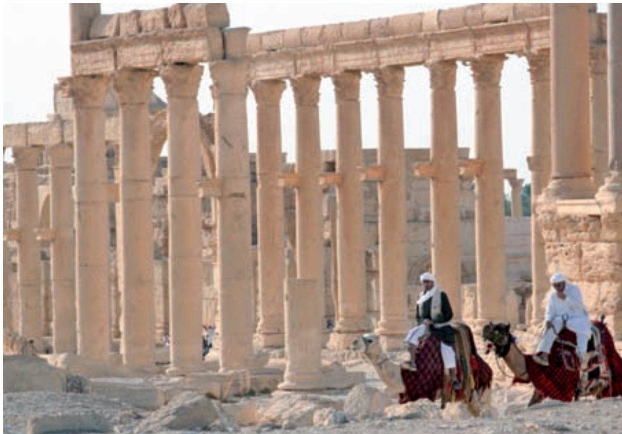
2010eko argazkian, Siriako Palmira hiri erromatar zaharraren aurriak, tartean ageri zirela orduan –azken gerra lehertu aurretik– turistak parajeotatik paseatzen zituzten gamelu eta gidariak.

Erromako Inperioaren makaltze eta eroriarena behin eta berriro eztabaidatutako kontua da, uste dugulako gure zibilizazioak jarraitu lezakeela Erromakoaren patu bera: makaldu eta erortzea. Erromakoan ikusi dezakegu hondoa jotzen duten [collapsing] gizarteen paradigma.