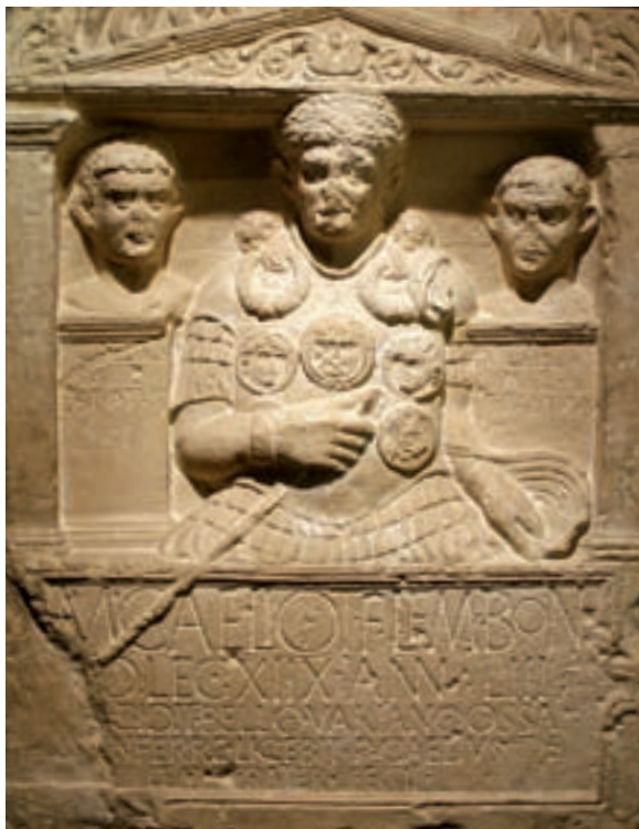
Marcus Caelius zenturioiaren hilarria. Bera izan zen Teutoburgetako guduan eroritako 18 zenturioietako bat.

Diocletianus enperadoreak Inperioa berpiztu zuen hau bilakatuz Brezneven garaiko Sobiet Batasuna gogorarazten digun zerbaiten antzeko. Diktadura zanpatzaile bat bere baitan zekartzana burokrazia itogarria, zerga handiak herritarrentzako eta egitura militar zamatsua. Inperioari hori guztia zama latza gertatu zitzaon eta mende baten buruan hondoratzera eraman zuen.