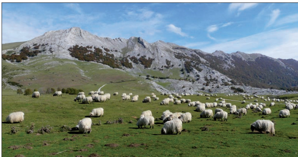
Aizkorriko gailurreria, Urbiatik ikusita.

Kilometroak falta dira oraindik Urtiagaineraino. Iferrutzeko lepoa igaro –tartean Enaitz gailurra igotzeko aukera– eta beherantz egingo