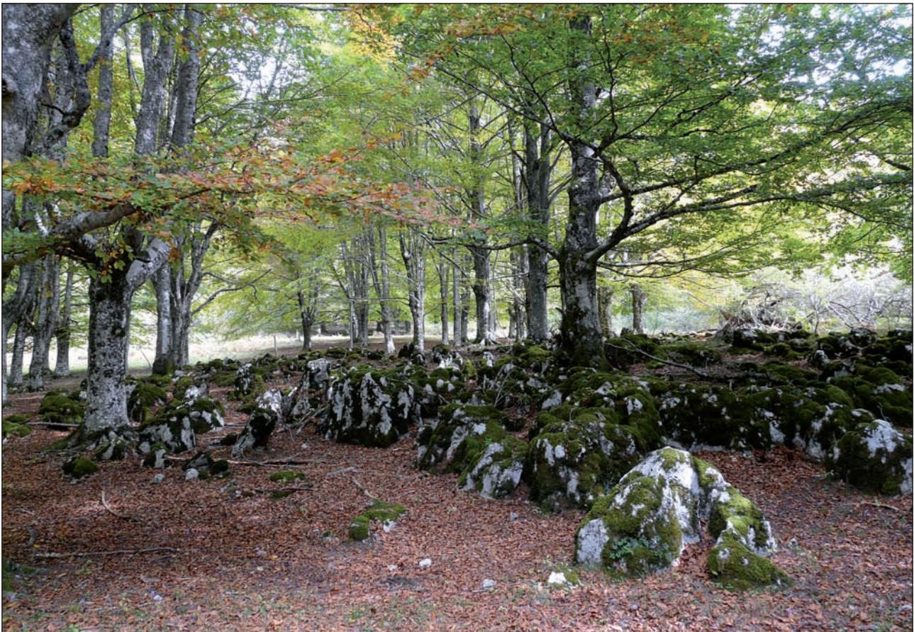
Pagadi zoragarria San Adrian inguruan.

Zegama aldetik Urbiara igotzeko makina bat aldiz jarraituko zuten Goierriko hamaika artzainek bide hau, oraindik ere artaldeak igo eta jaisteko erabiltzen dena. Dagoeneko udazkenean bete-betea sarturik gaudela kontuan hartuz, Urbian oraindik dauden artaldeei ez zaie Andraitzeko pasabidean barrera bialarara jaisteko denbora askorik gertzen... Iraun dezatela, etorkizunean ere, aspaldiko usadio zaharrek!