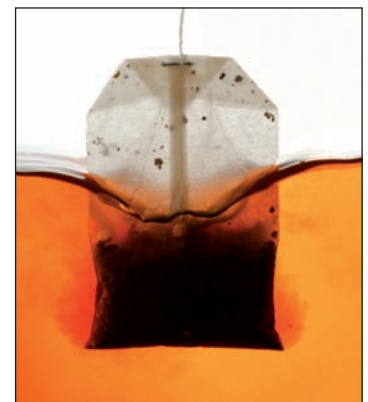
Hasiera batean, ondo bilduta egoteko sartu zuten tea poltsatxoetan, eta ez zuzenean uretan sartzeko.