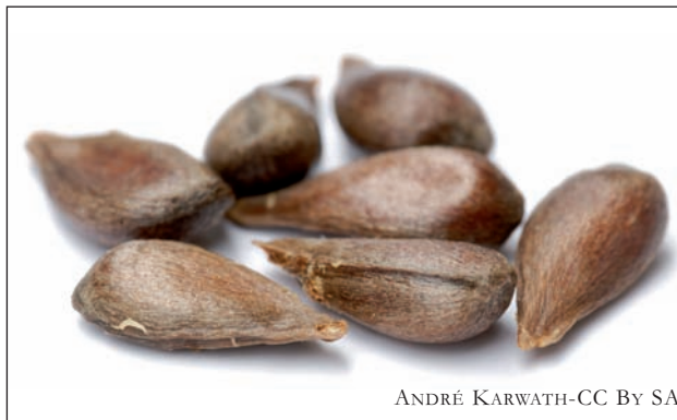
ANDRÉ KARWATH-CC BY SA

Hazia beti da mirakulua. Hazia aitaren eta amaren arteko nahasketaren emaitza gorena da. Arraren eta emearen arteko gurutzatzea.