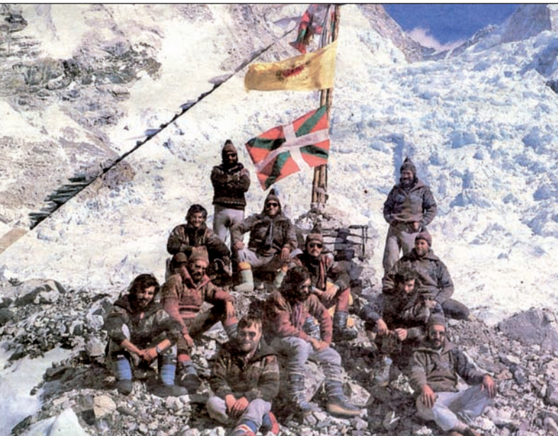
1980ko espedizioko kideak, atzean ikurrina eta "Nuklearrik ez" ikurra dituztela.