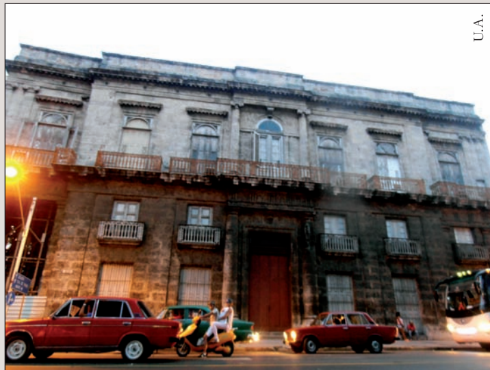
Simon Bolivar hiribidean habanarren autoak apenas geratzen dira Aldama jauregiaren aurrean. Gordexolarrak eraikiarazitako edifizio dotorea harri zuriaz gain odol gorriaz ere egina da ordea.

Agidanean, jauregiko lanak nahiko geldirik zeuden harria falta zelako, eta Alda-