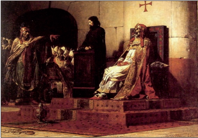
Jean Paul Laurensen Formoso aita santua eta Esteban VI.a , (1870), Formosoren hilotzaren aurkako epaiketa irudikatzen duen koadroa.

ERROMA, 896. Formoso I.a aita santua hil zen modu susmagarrian, zantzu guztien arabera Spoleto tarrek, Italiako noble familia boteretsuenetakoak, pozoituta. Formoso traidoretzat zuten Guido di Spoleto Italiako tronutik egozteko lortu zuelako. San Pedoren jarlekuan Bonifazio VI.a eseri zen orduan, baina ez luzaroan. Garai nahasiak ziren Vatikanon, mende eskasean 24 aita santu izendatu zituzten eta intrigak, konspirazioak, hilketak... ziren eguneroko ogia. Ondoren, Esteban VI.a izendatu zuten aita santu –hark ere ez zuen urtea beteko karguan– eta Lamberto di Spoleto ren alde lerratu zen berehala. Spoleto k Formosoren traizioa kondenatzeko eskatu zion aita santu berriari.