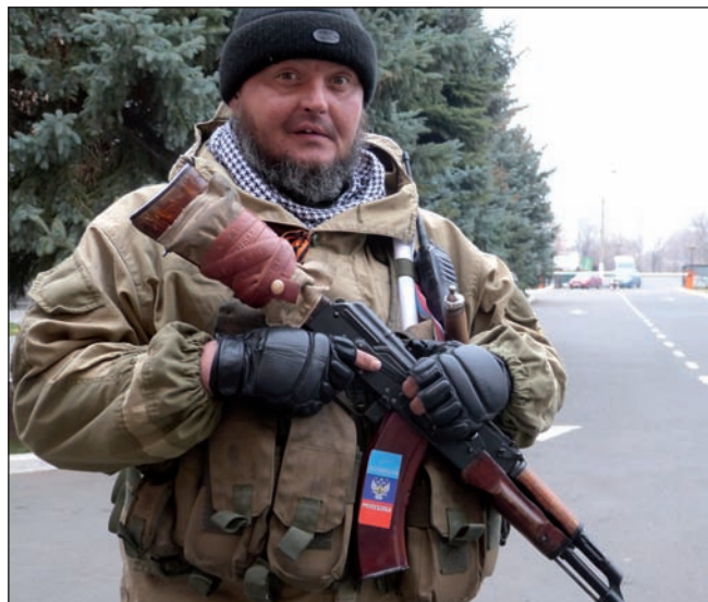
Lehenengoan, herri milizietako kideak gerra-frontean; bigarrenean, Luhanskeko kosako bat eta hirugarrengoan, kosakoen fronteko komandantea, Ukrainako artilleriak bonbardatutako eraikin baten aurrean.

herritar batek esan digu hori bonbardatu berri duten eraikin baten aurrean: “Gaur eraikin hau bonbardatu dute, eta orain dela gutxi Lenin kalea bonbardatzen ari ziren”. Slobianoserbsk Luhanskeko ipar-mendebaldeko herri bat da. Umeak futbolearen ari dira bonbak orduro