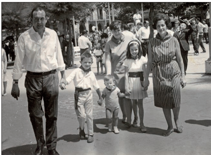
ETXEBERRIAREN SENIDEK UTZIA