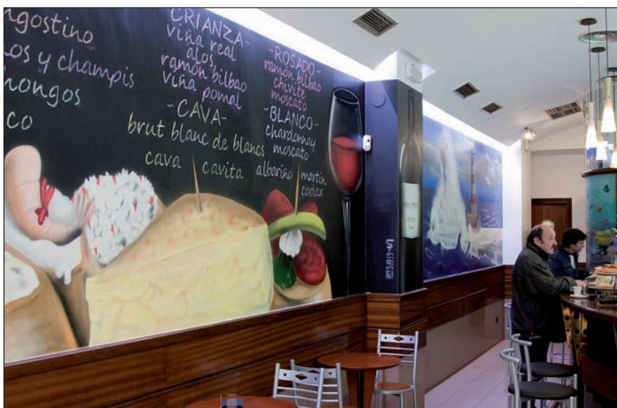
Iñaki tabernako horma-irudia, Donostian.

Gazteak izanagatik ere, Artefactoryko margolariek 20 urteko esperientzia dute