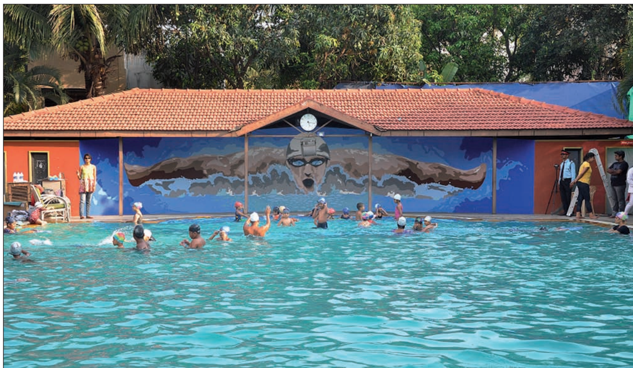
Artefactorykoek egindako horma-irudi bat, Indian.

Proiektu berrienetakoa Deban gauzatu dute. Euskal Herriko horma-irudirik handiena da, 28 metro luze baititu eta 500m 2 -ko azalera. “Gainera, herriaren sarreran eta hondartzaren ondoan dagoenez, are eta ikusgarriagoa da” dio Unzuetak. Aurretik hainbat lan egin dituzte. Esate baterako, Pedro Subijanaeren Akellarre jatetxean, Kutxan, Beffeater enpresak eskatuta, Urbil merkataritza zentroan, Sr. Goldwin, Deba eta Segurako